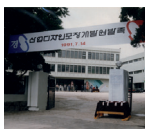
1991 산업디자인포장개발원 발족