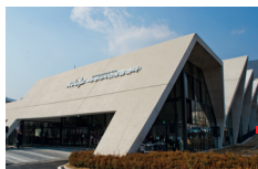
2015 미래디자인융합센터 개관