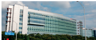
2001 코리아디자인센터(KDC) 입주 경기도 성남시 분당구 아람동