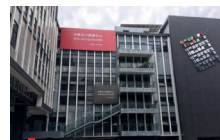
2019 한국디자인 순터 비즈니스 개소