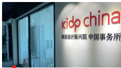
2013 한국디자인진흥원 중국센터