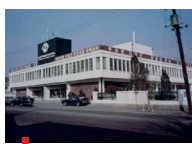
1970 한국디자인포장센터 설립 서울시 중로구 에와동 대학교