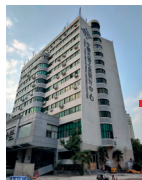
2015 한국디자인 아우 비즈니스 개소