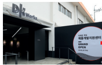
2019 DK웍스 디자인주도 제품개발혁신센터 개소