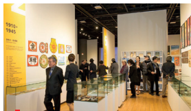
2020 디자인 코리아 뮤지엄 개관