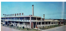
1973 한국디자인포장센터 공장 개원