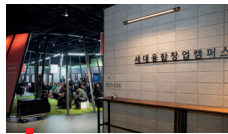
2018 세대융합창업캠퍼스 개소